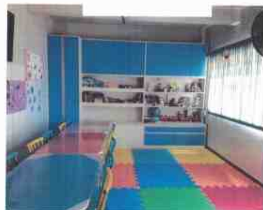
Sala de Atividades (Diversas)