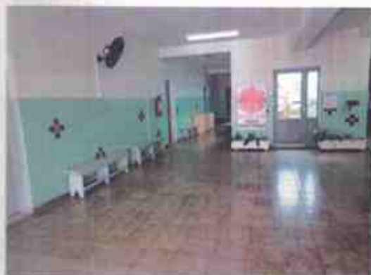
Hall para reuniões