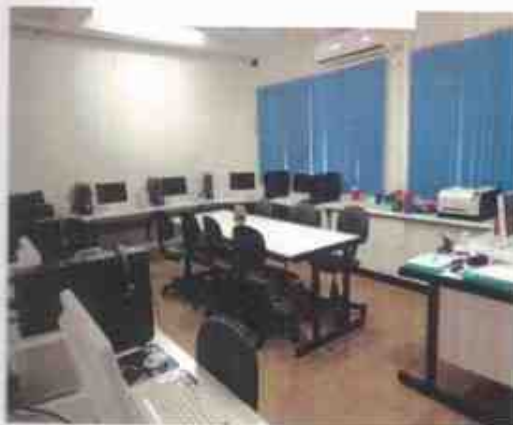
Sala de Atividades (Informática)