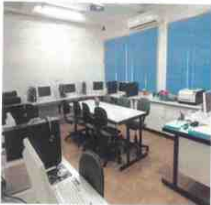
Sala de atividades (informática)