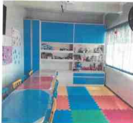
Sala de atividades (diversas)