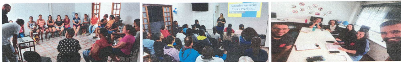
Reunião e Assembléia de pais e responsáveis