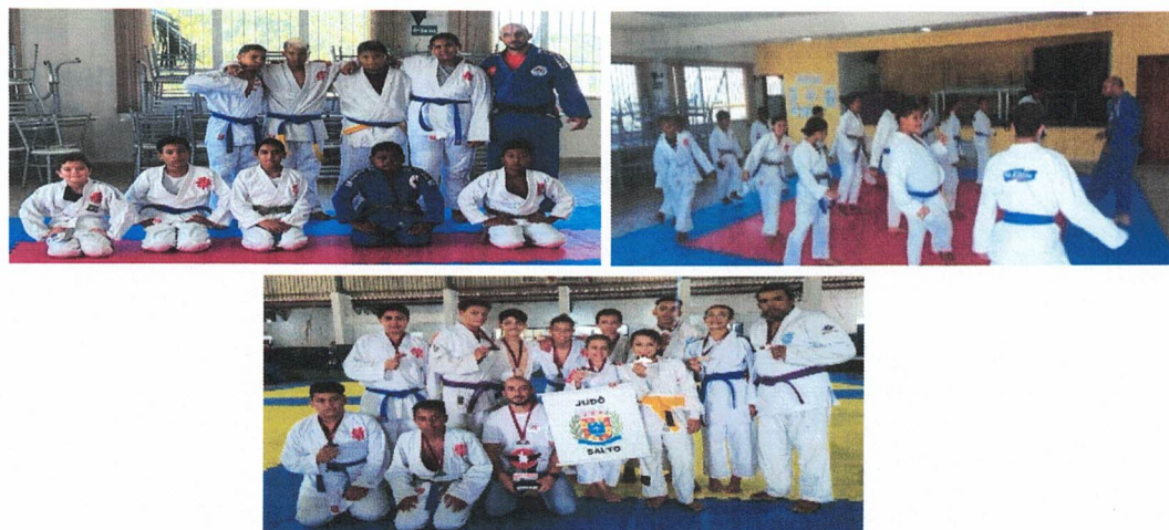
Campeonato de Judô – Cesário Lange