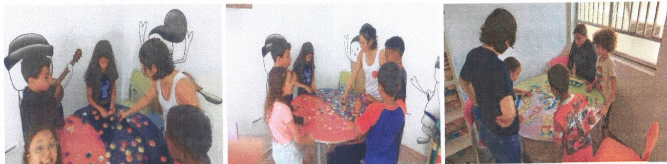
Fotos....Balé Violão e Banda